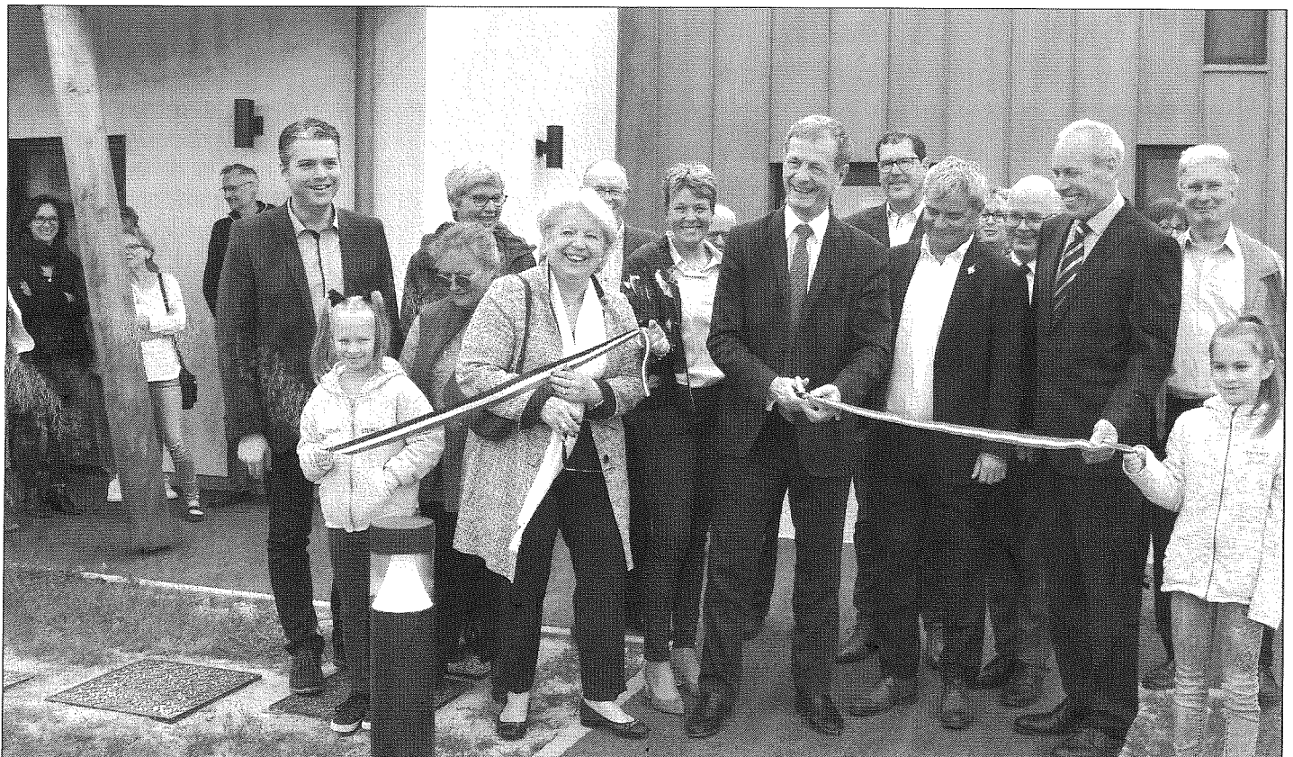
18 mai 2019 à Flévy (canton du Pays messin) : Inauguration de l'accueil pour la petite enfance en présence de Jean-Louis MASSON et Marie-Jo ZIMMERMANN

Cliquer : http://www.senat.fr/leg/pp18-333.pdf